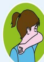
IN DIE ARMBEUGE