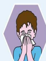
IN EIN PAPIERTASCHENTUCH