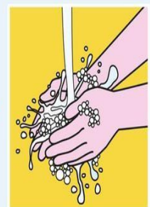
HÄNDEWASCHEN NICHT VERGESSEN